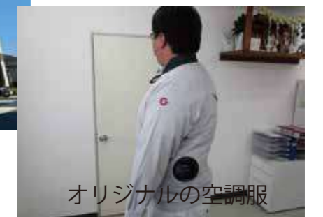
オリジナルの空調服