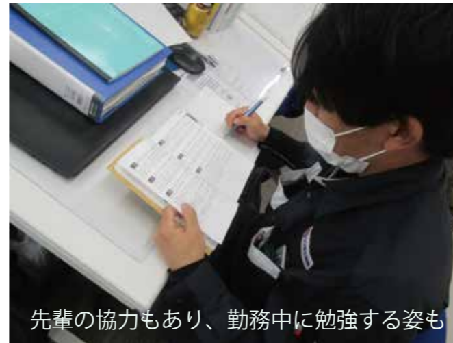
先輩の協力もあり、勤務中に勉強する姿も

シン建工業には、建築学科・土木学科以外の卒業生も多く入社しております。建設業を1から学べる資格取得サポート制度があるので未経験でも安心！なんと週に1回、就業時間中に資格の学校に通えるのです。もちろん学費も交通費も全額会社負担。無理なく“国家資格”を取得できちゃいます。