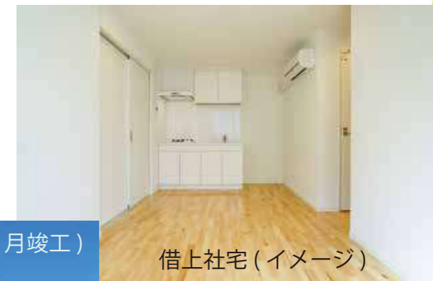
借上社宅（イメージ）

その他、夏の空調服貸与やスポーツドリンク、塩飴の支給。冬の防寒着貸与、iPhoneの貸与など、働きやすい環境作りに取り組んでいます。