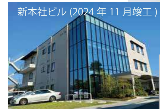
新本社ビル（2024年11月竣工）